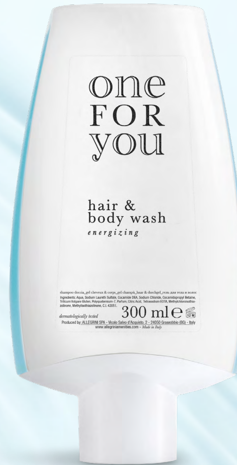
shampoo doccia ConTatto 300 ml