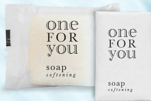
sapone flow pack 15 g