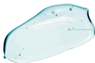
SHOWER GEL RELAXING

Ingredienti unici e ricercati compongono questa linea: l' estratto di semi di lino possiede proprietà emollienti e lenitive che lo rendono adatto anche per le pelli più delicate; agisce inoltre sul capello donandogli nutrimento e forza. La vitamina E possiede invece proprietà antiossidanti agendo contro l'invecchiamento della pelle.