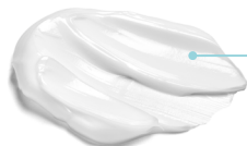
BODY LOTION MOISTURIZING

Una formulazione dalla schiuma delicata, ideale per detergere, nutrire ed ammorbidire la pelle. Un'esperienza avvolgente capace di donare vitalità a tutto il corpo.