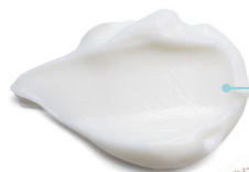
HAIR CONDITIONER NOURISHING

Shampoo adatto a tutti i tipi di capelli. Deterge e regala nutrimento al capello che, dopo il trattamento, risulta luminoso e lucente.