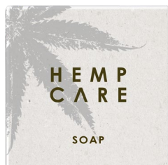
Organic Hemp Oil