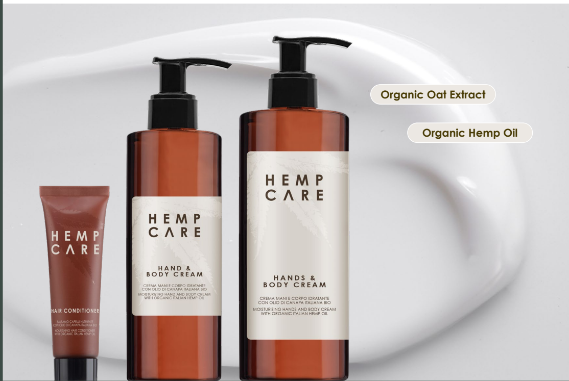
Organic Oat Extract

Body cream that absorbs quickly, relieving dry skin and invigorating the senses. Provides nourishment and is ideal for softening and refreshing the skin thanks to the presence of high-quality Organic Hemp Oil. The Organic Oat extract also helps to restore the skin's barrier function, improving dry skin conditions quickly.