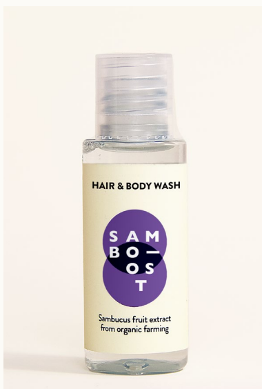
HAIR & BODY WASH - 30 ml Shampoo doccia con estratto di frutti di Sambuco da agricoltura biologica.