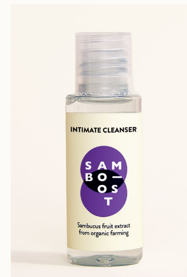
INTIMATE CLEANSER - 30 ml Igiene intima con estratto di frutti di Sambuco da agricoltura biologica.