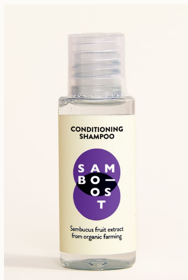
CONDITIONING SHAMPOO - 30 ml Shampoo condizionante con estratto di frutti di Sambuco da agricoltura biologica.