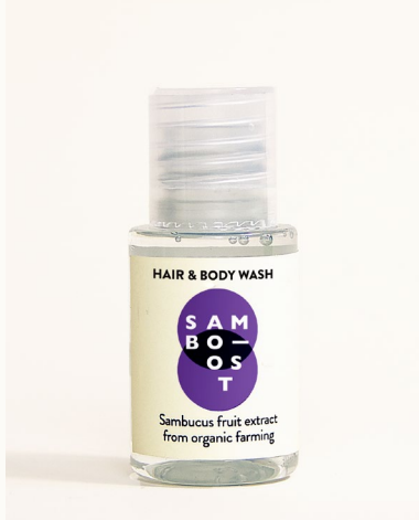
HAIR & BODY WASH - 20 ml Shampoo doccia con estratto di frutti di Sambuco da agricoltura biologica.