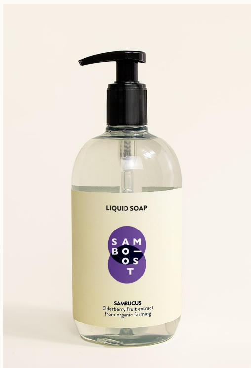
LIQUID SOAP - 500 ml Sapone liquido con estratto di frutti di Sambuco da agricoltura biologica.