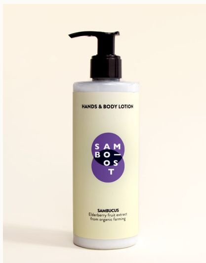
HANDS & BODY LOTION - 300 ml Crema mani e corpo con estratto di frutti di Sambuco da agricoltura biologica.