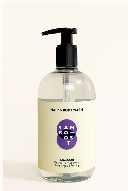
HAIR & BODY WASH - 500 ml Shampoo doccia con estratto di frutti di Sambuco da agricoltura biologica.