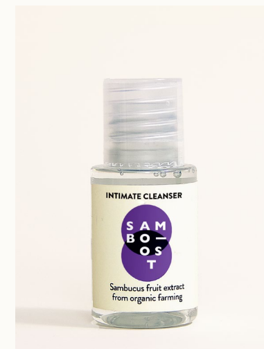
INTIMATE CLEANSER - 20 ml Igiene intima con estratto di frutti di Sambuco da agricoltura biologica.