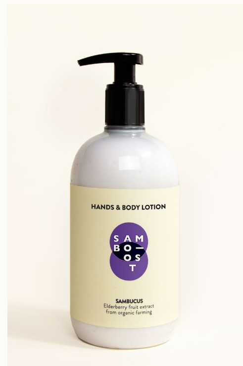
HANDS & BODY LOTION - 500 ml Crema mani e corpo con estratto di frutti di Sambuco da agricoltura biologica.