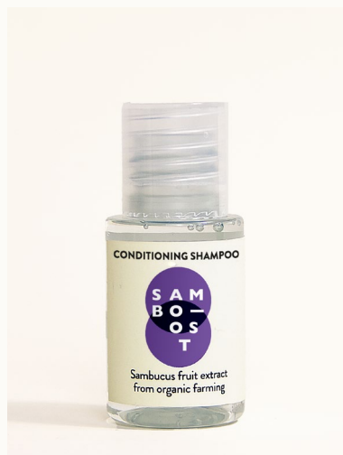
CONDITIONING SHAMPOO - 20 ml Shampoo condizionante con estratto di frutti di Sambuco da agricoltura biologica.