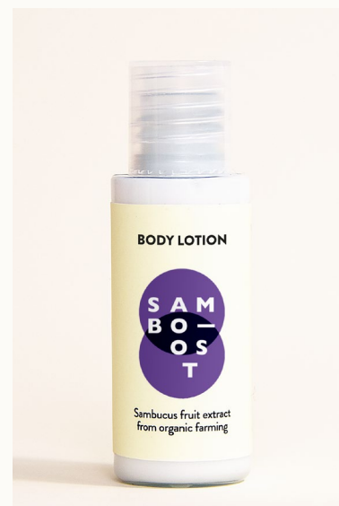
BODY LOTION - 30 ml Crema corpo con estratto di frutti di Sambuco da agricoltura biologica.