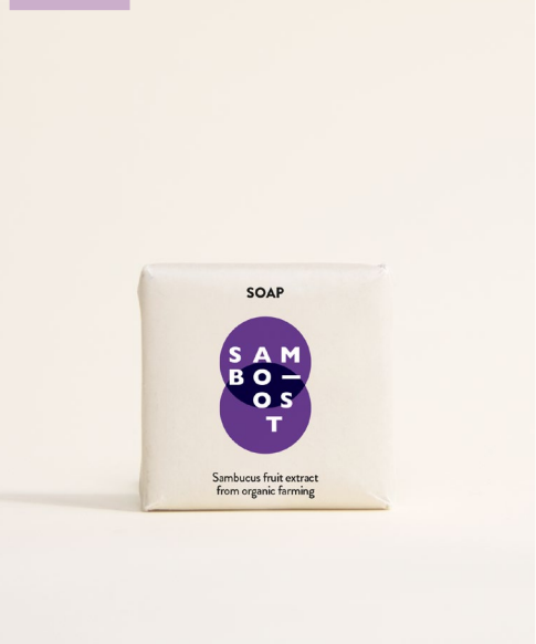
SOAP - 15 g Sapone vegetale con estratto di frutti di Sambuco da agricoltura biologica.