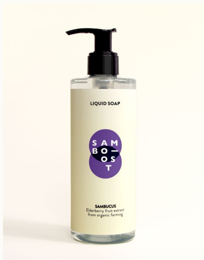
LIQUID SOAP - 300 ml Sapone liquido con estratto di frutti di Sambuco da agricoltura biologica.