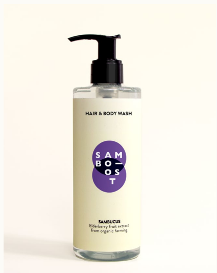
HAIR & BODY WASH - 300 ml Shampoo doccia con estratto di frutti di Sambuco da agricoltura biologica.