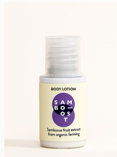
BODY LOTION - 20 ml Crema corpo con estratto di frutti di Sambuco da agricoltura biologica.